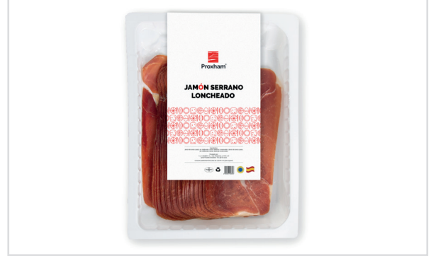
Foto del producto