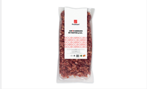
Foto del producto