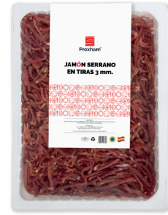
Foto del producto